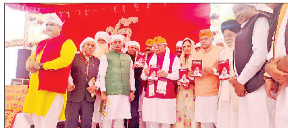
जींद। हरियाणा साहित्य अकादमी के निदेशक डा. धर्मदेव विद्यार्थी की 52वीं पुस्तक का विमोचन करते केंद्रीय मंत्री मनोहरलाल।

एसडीएम अजय हुड्डा ने बताया कि नगरपालिका कलायत के उप-प्रधान पद के लिए 21 नवंबर को चुनावी बैठक होगी है। राज्य निर्वाचन आयोग हरियाणा द्वारा जारी अधिसूचना के तहत यह बैठक होगी। बैठक के लिए सुबह 10 बजे का समय निर्धारित किया गया है। जननिर्णय प्रक्रियाओं को दिनांक 25 मार्च को पंचकुला में शपथ दिलाई गई थी। नानाकन जयों की जांच सुबह 11: 30 से दोपहर 12 बजे तक होगी। नाम वापसी का समय दोपहर 12 बजे से दोपहर 12: 30 बजे तक तय रहेगा। मतदान दोपहर 1 से 2 बजे तक। मतदान के तुरंत बाद परिणाम घोषित होगा।