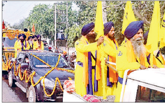
जींद। गोहाना रोड पर पहुंची हिंद की चादर तीसरी शहीदी यात्रा।