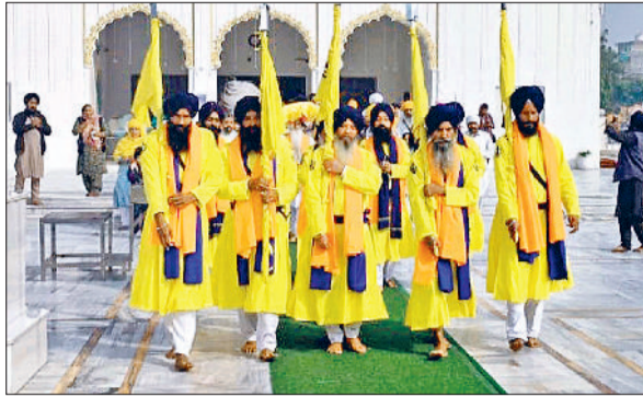
जींद। नगर कीर्तन की अगुवाई करते हुए पंज प्यारों।