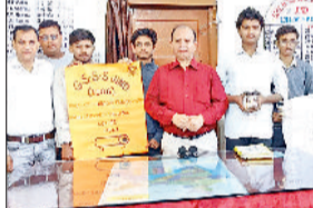
जींद। प्रतियोगिता के विजेता विद्यार्थी बीईओ के साथ।

जींद। खंड शिक्षा कार्यालय में कौशल बिजनेस चैलेंज नामक प्रतियोगिता का आयोजन किया गया। इसमें खंड के विभिन्न विद्यालयों से आए कौशल विकास विभाग के शिक्षकों और विद्यार्थियों ने अपनी-अपनी टीमों के साथ भाग लिया। बच्चों ने अपने कल्पनाशील मस्तिष्क और नवोन्मेषी सोच से ऐसे-ऐसे प्रेरणादायक बिजनेस मॉडल प्रस्तुत किए कि दर्शक और निर्णायक मंडल अभिभूत रह गए। प्रत्येक मॉडल में युवाओं की ऊर्जा, आत्मविश्वास और भारत को आत्मनिर्भर बनाने की भावना स्पष्ट झलक रही थी। प्रतियोगिता में वरिष्ठ