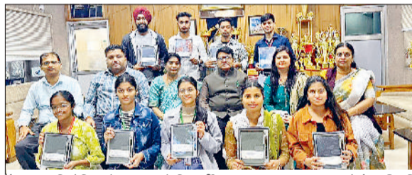
कैथल। प्रतियोगिता में अबल रहे विद्यार्थी।