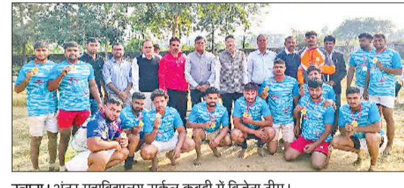
उद्याना। अंतर महाविद्यालय सर्कल कबड्डी में विजेता टीम।